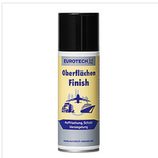
Réf. 836 200 Bombe aérosol 200 ml