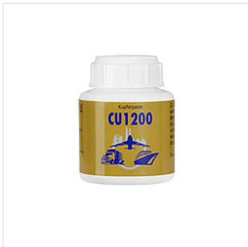
Art. Nr. 810 800 Pinseldose 140 gr.