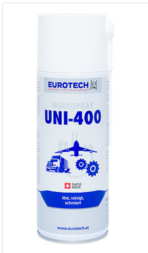
Réf. 816 400 Bombe aérosol 400 ml