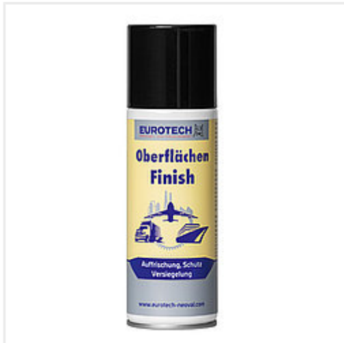
Art. Nr. 836 200 Aerosoldose 200 ml